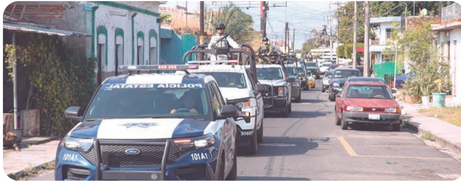
Elementos de diversas corporaciones participaron en este operativo de seguridad.