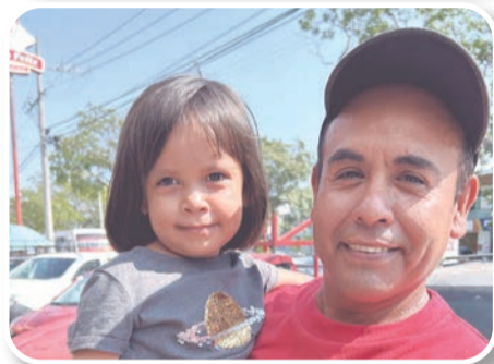
Familias del estado compartieron cómo despedirán 2025 y darán la bienvenida al Año Nuevo.