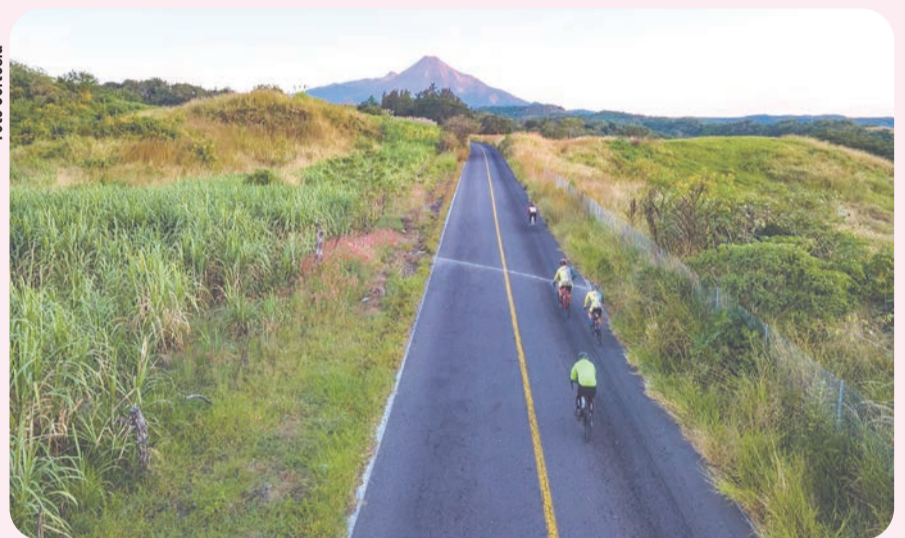
La Villa cuenta con alternativas que promueven el turismo rural, fomentan la naturaleza, la gastronomía y su historia.