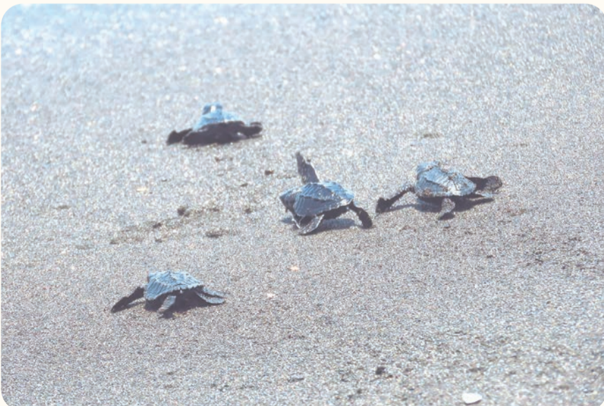
El centro informó que la liberación de crías será a las 12 del mediodía.