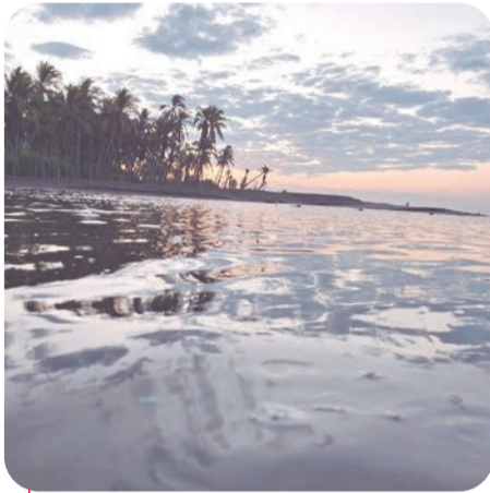
Solicitan el apoyo de las autoridades para lograr vigilar hasta 20 kilómetros de playa.

TECOMÁN.- Integrantes de la cooperativa de Tecuanillo denunciaron la ausencia de personal encargado del cuidado y protección de tortugas marinas durante un recorrido nocturno en el campamento tortuguero de la zona.