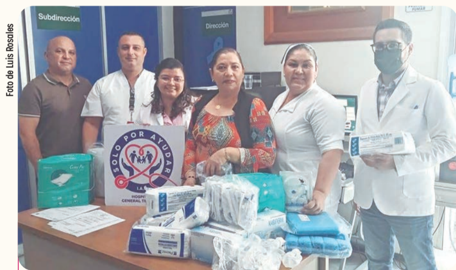
La Clínica San Pablo realizó la donación de víveres e insumos al nosocomio de Tecomán.

Ignacio Ponce informó una baja de 85 por ciento en homicidios y de 39 por ciento en robos, avances atribuidos al trabajo coordinado entre los tres niveles de gobierno.