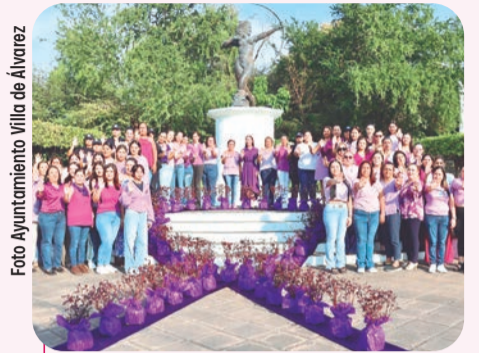
La alcaldesa encabeza la ceremonia de conmemoración.

La alcaldesa destacó el diseño, implementación y actualización de la aplicación Botón Diana 3.0, desde la cual pueden solicitar auxilio de la Policía Municipal desde los teléfonos celulares