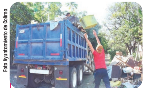
El gobierno municipal invitó a las familias a participar en esta campaña, a fin de generar entornos más saludables.

Hoy se atenderán las colonias Lomas Vista Hermosa y Guadalajarita, y para el jueves las brigadas continuarán en Jardines Vista Hermosa 1, 2 y 3, La Cantera, Las Pérgolas y Parque Royal