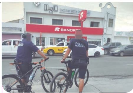
Autoridades destacaron avances en seguridad durante reunión de evaluación.