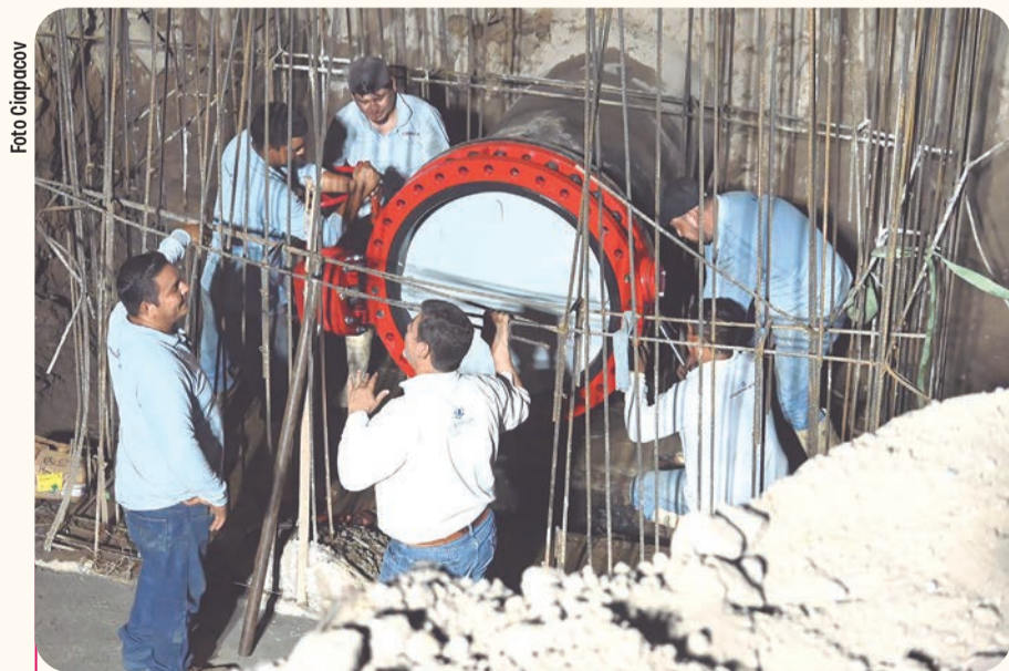
La institución reportó avances en la renovación de redes de agua potable y la sustitución de tuberías de drenaje obsoletas.

De cara al próximo año 2026, el director adelantó que se reforzará la inversión y la cercanía social mediante el programa Diálogos Por El Agua además de mantener esquemas de apoyo para la regularización de adeudos.