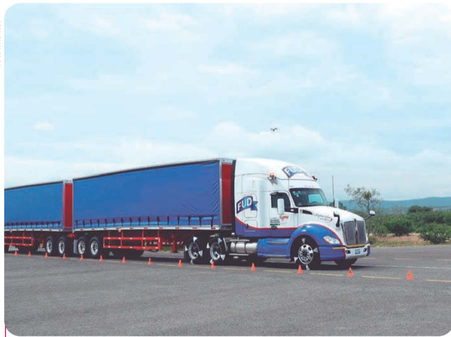
Organismos empresariales y la SICT buscan liberar las carreteras de Colima para proteger a turistas y familias.