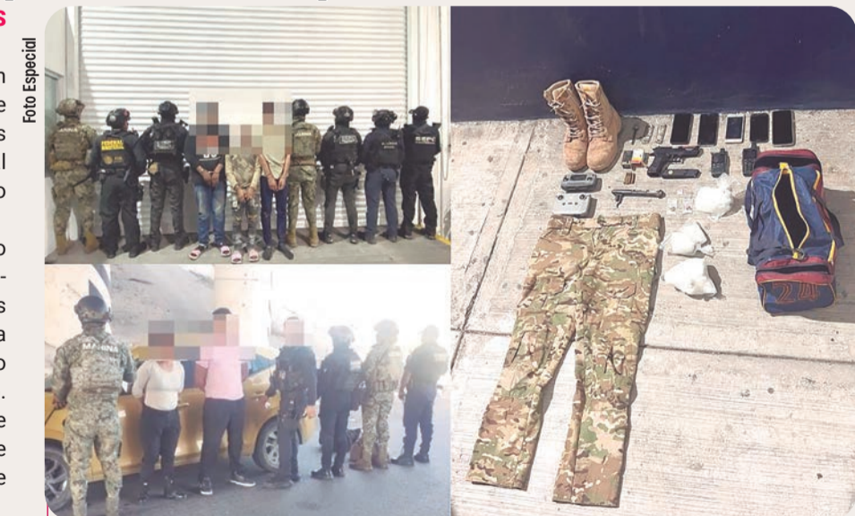
La Marina aseguró armas, droga y equipo táctico durante operativos del Plan Michoacán por la Paz y Justicia.

En el poblado de Nexpa, un individuo abandonó una mochila al notar la presencia naval; en su interior se localizaron armas largas y cortas, cargadores, cartuchos, un chaleco táctico y presunta cocaína. En Lázaro Cárdenas se aseguró una motocicleta con alteraciones en sus