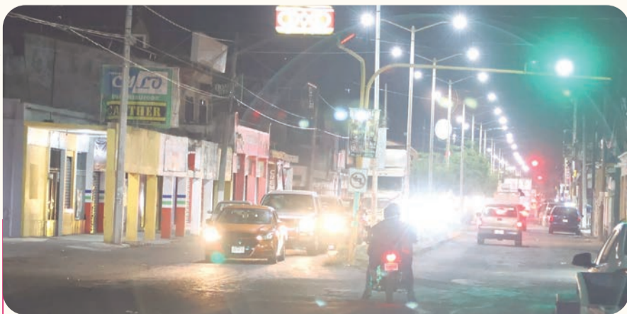
Comerciantes alertan por el paso de pipas y camiones pesados por la zona centro de Armería.