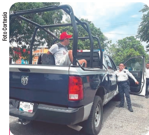
La labor informativa fue obstruida ilegalmente mediante actos de abuso de autoridad que vulneran el derecho a la información.

los funcionarios obstruyeron ilegalmente las labores informativas de un comunicador, mientras éste realizaba grabaciones de interés público en la calle, actividad que se encuentra estrictamente protegida por la Constitución, y que