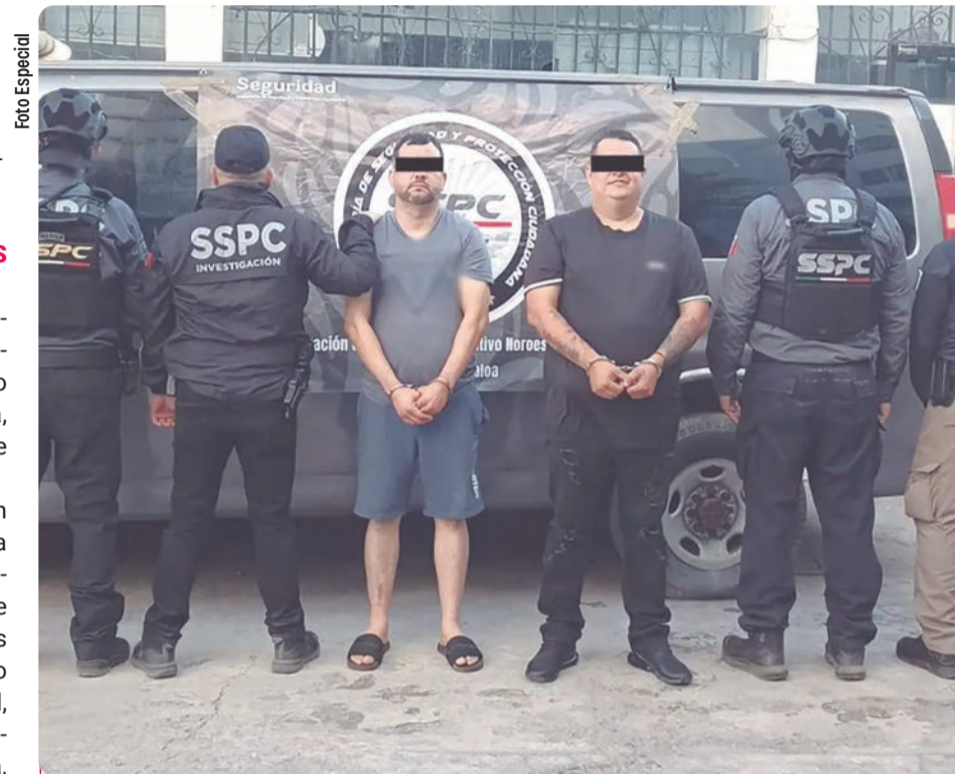
Fuerzas federales aseguraron armas, droga y vehículos tras operativos simultáneos en Sinaloa y Jalisco.