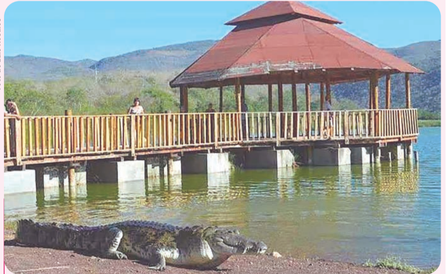
El Cocodrilaro de Cofradía de Hidalgo permanece abierto al público.