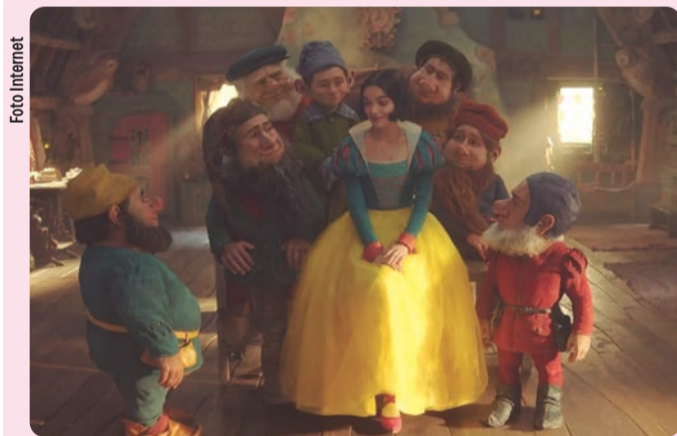
La nueva versión en acción real de Blanca Nieves encabeza la lista.