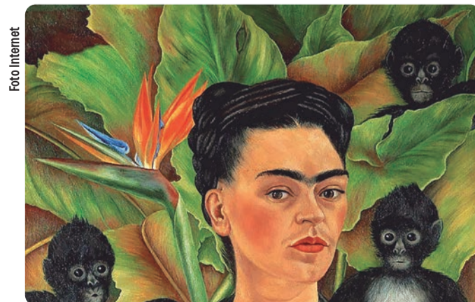
Aspectos de la pintura "Autorretrato con monos", de Frida Kahlo.