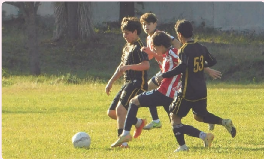
El líder Lázaro Cárdenas descansará este fin de semana.