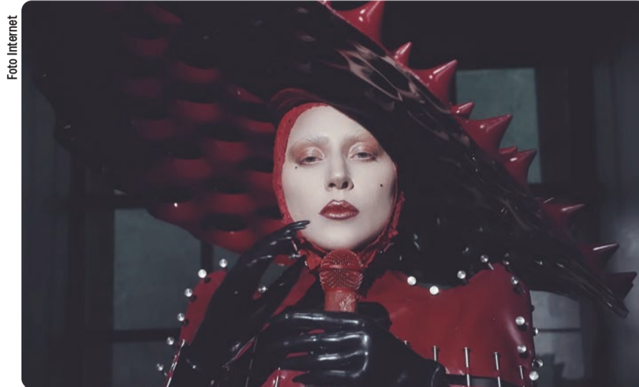
Lady Gaga se encuentra entre las más nominadas del año.

Le siguen Lady Gaga, Jack Antonoff y el productor canadiense Cirkut, con siete