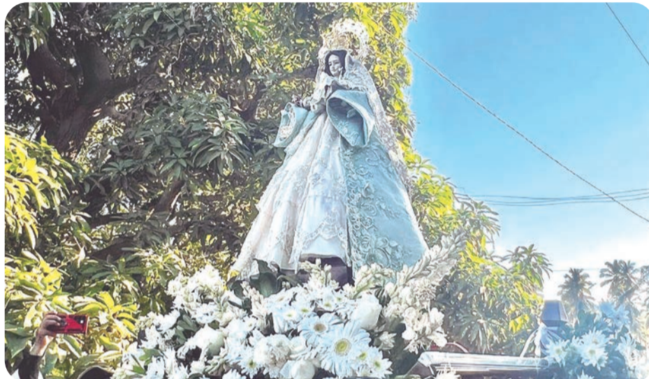
El 1 y 2 de febrero se llevarán a cabo las fiestas en honor a la Virgen de la Candelaria.