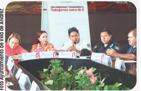
La alcaldesa destacó que el balance alentador es producto de las acciones preventivas que realizó el municipio.

dejó de llover antes de lo previsto, lo que implica que se adelante la temporada de estiaje, por lo que llamó a redoblar esfuerzos ante la posibilidad de incendios.