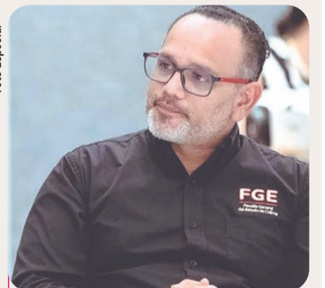
El fiscal exhortó a los municipios a utilizar correctamente los recursos.