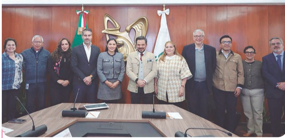
La gobernadora Indira Vizcaíno sostuvo una reunión con el director general del IMSS, Zoé Robledo.