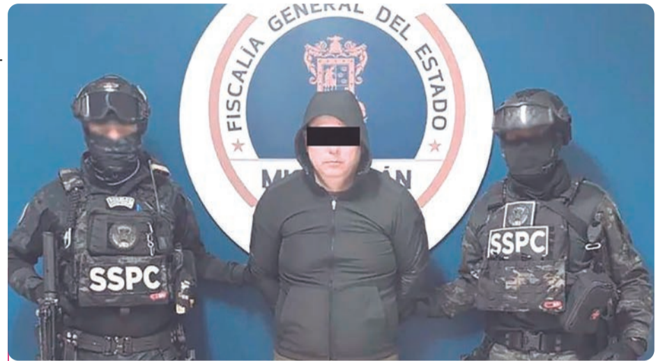
El Licenciado fue capturado en Morelia, Michoacán.