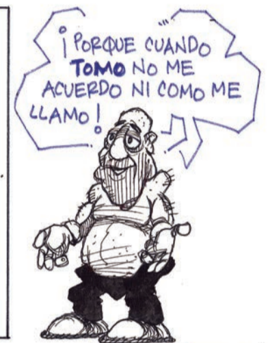
SÍGUENOS EN ROBI CARTÓN