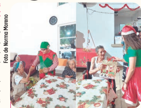
El Asilo de Ancianos de Manzanillo IAP realizó la posada navideña, con trabajadores y asilados.

El festejo se desarrolló en un ambiente de convivencia, emoción y alegría, que dejó momentos entrañables para todos