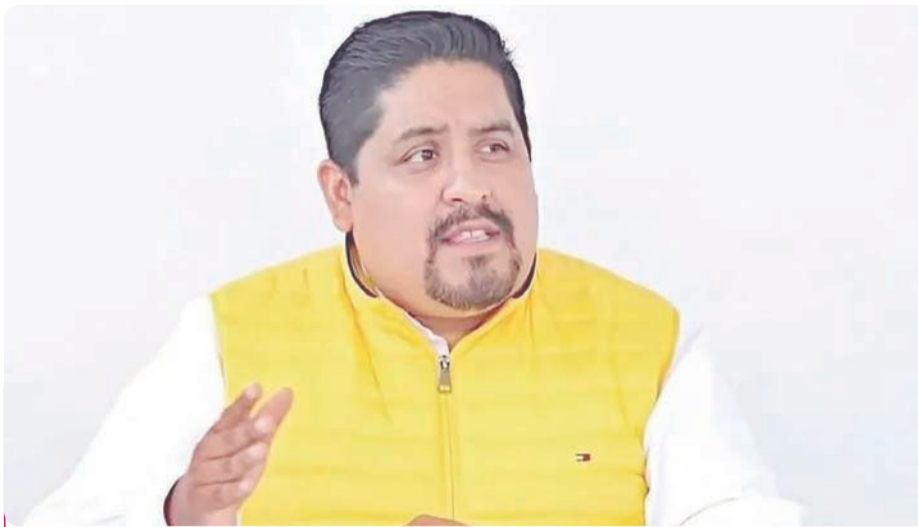
El Yeicob es señalado de encabezar el contrabando de combustible desde Estados Unidos hacia Tamaulipas.