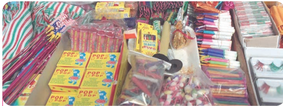
Las brigadas de Protección Civil mantendrán patrullajes constantes para vigilar que los vendedores autorizados no violen las normas.

En caso de adquirir estos productos, autoridades exhortan se haga en los sitios autorizados y bajo supervisión