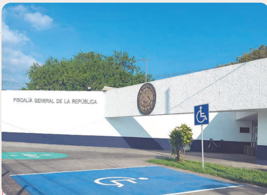
La FGR informó que las dos personas fueron detenidas en la colonia Playa Azul en Manzanillo.