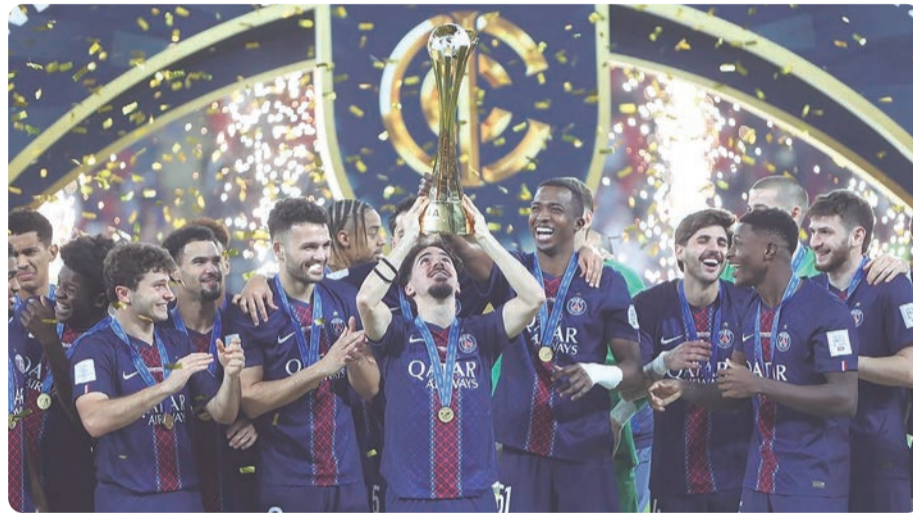
Con este triunfo, el conjunto alcanzó su sexto título de la campaña.

Nicolás de la Cruz fue el único jugador del Flamengo que logró anotar desde los once pasos, mientras que sus compañeros Saúl Ñíguez, Pedro, Léo Pe-