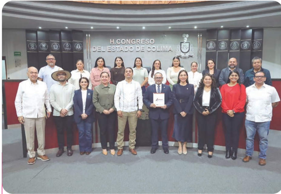
Durante la presentación de su 4º Informe, la FGE destacó la reducción de 24 por ciento en muertes violentas durante 2025.