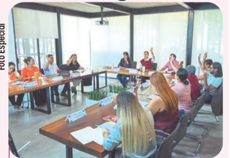
Con este ajuste, el predial se calculará conforme al valor actual de las propiedades.

Con la reforma, se busca aliviar la carga a las clases populares y fomentar