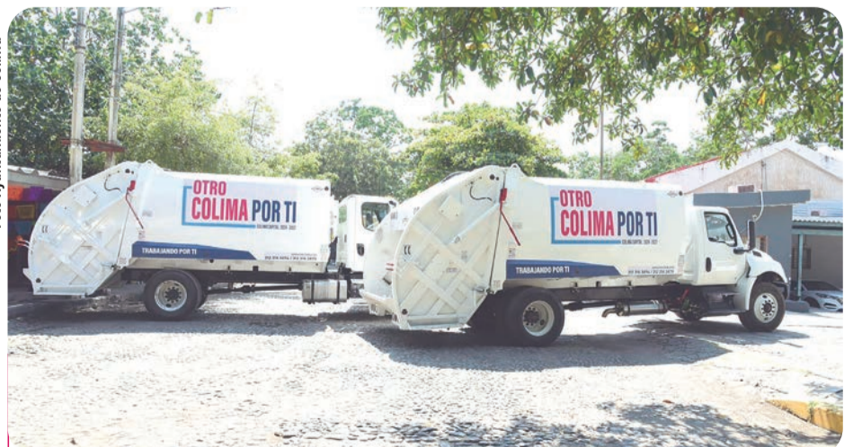
El servicio de recolección de basura no se suspenderá en días festivos.