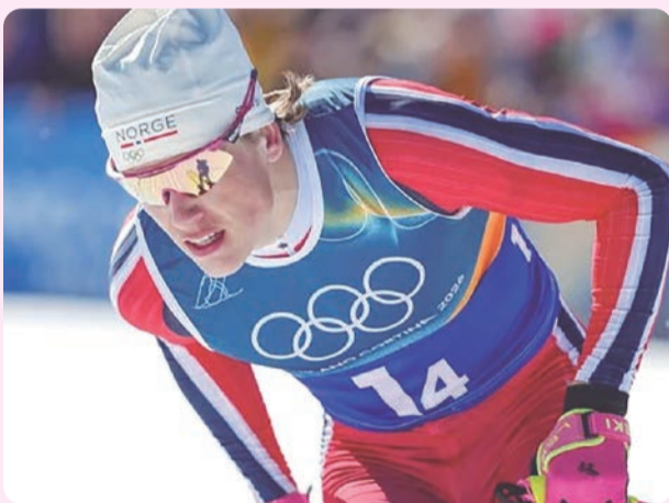
Johannes Hoesflot Klaebo.