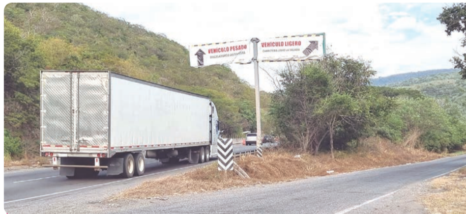
Automovilistas piden la presencia de las autoridades en la carretera libre.

zar la vía libre, lo que ha provocado mayor congestión, maniobras riesgosas y largos tiempos de traslado.