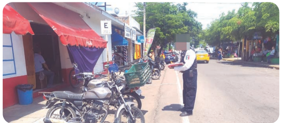
La revisión incluirá que los escapes de las motocicletas no estén alterados.