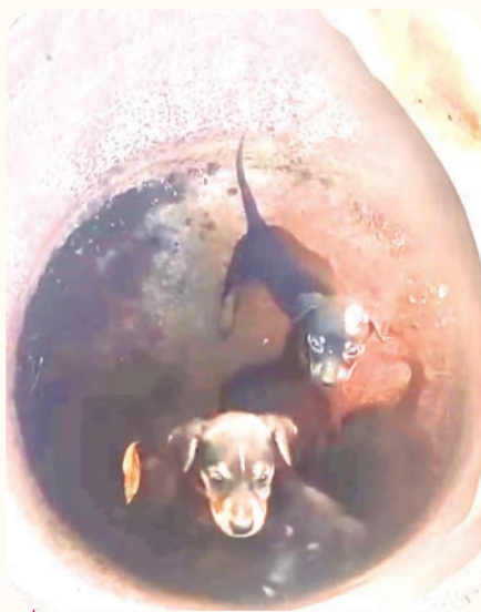
Colectivos animalistas piden endurecer las sanciones contra el maltrato y abandono animal.

severas contra el maltrato y abandono animal.