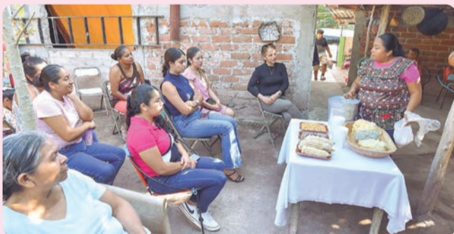
El proyecto brindará talleres gratuitos a las familias ixtlahuaquenses, con enfoque en las generaciones más jóvenes.