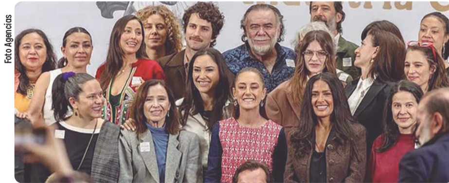
La presidenta Claudia Sheinbaum anunció un plan integral de apoyo al cine nacional, desde la formación, producción, exhibición y preservación.

sión de la presidenta para apoyar al cine mexicano y con ello generar orgullo a México a través de narrativas auténticas y reales. Además, señaló que con estos incentivos se promueve el turismo y se genera una inyección económica, artística, gastronómica y cultural. "A partir de este apoyo no tenemos comparación, no hay país en el mundo que tenga la diversidad ecológica, la belleza, aquí lo hay todo. No existe otro país que tenga lo que tenemos", aseguró.