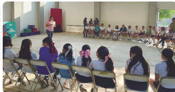
En la Fábrica de Innovación Creativa (FIC) de la colonia El Tívoli, el Gobierno del Estado celebró la fecha con una jornada de actividades recreativas.