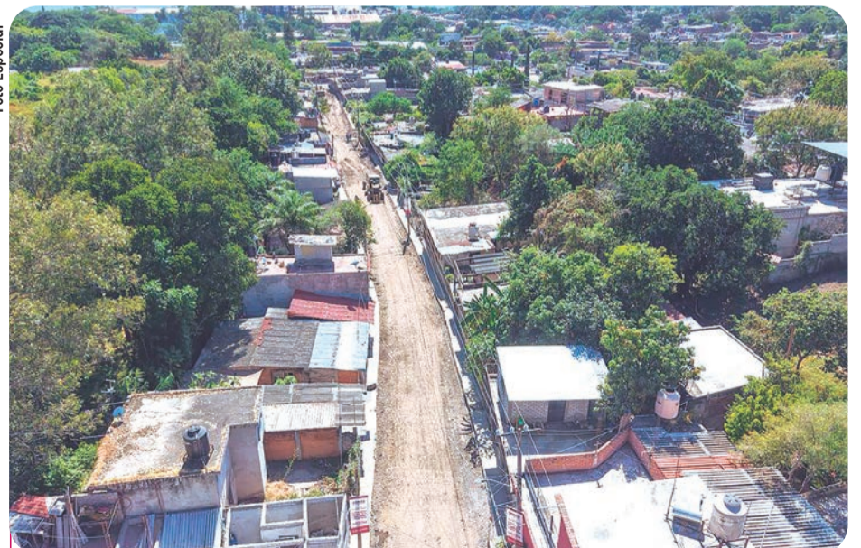
Esta vialidad en Cuauhtémoc beneficiará a más de 3 mil 900 habitantes.