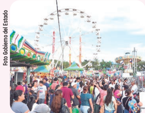
Las actividades de la Feria arrancan a las 4:30 de la tarde.

El Teatro del Pueblo presentará a las 5:30 de la tarde al Ballet Inclusivo "Amor y Esperanza", seguido del grupo de bastoneras y pomponeras de Villa