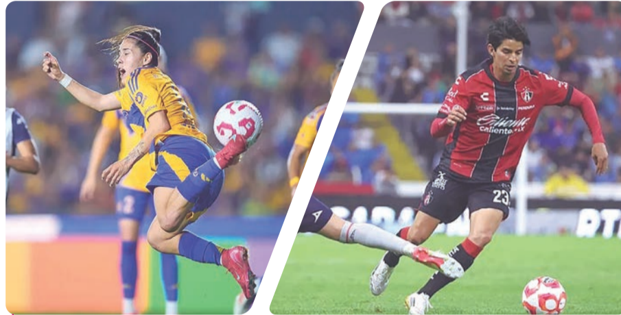
La postulación responde a sus destacadas ejecuciones en el ciclo futbolístico 2024-2025.