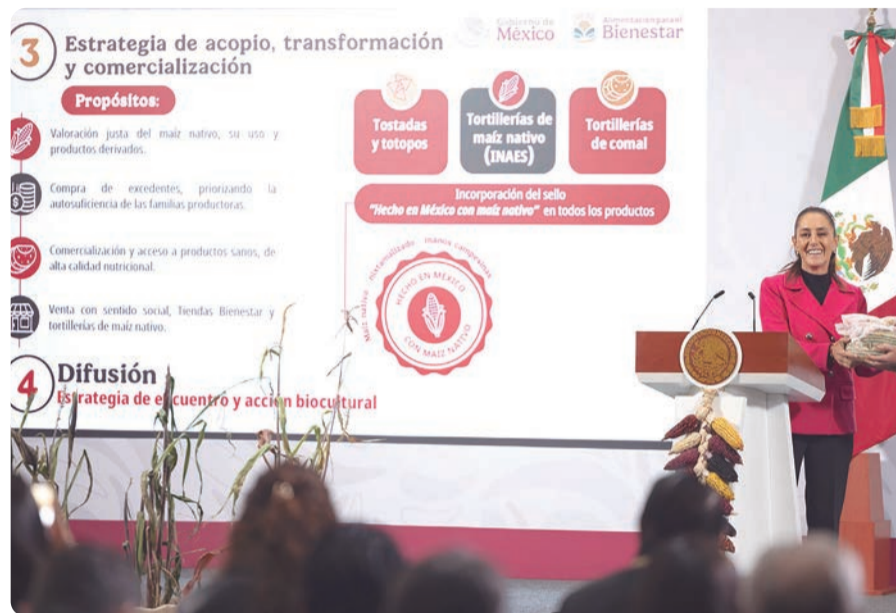
Aspecto de la conferencia de prensa de la presidenta Claudia Sheinbaum en Palacio Nacional.

El nuevo programa fomentará el uso de maquinaria ligera adaptada a cada región, bajo esquemas colectivos, y promoverá la transformación del grano en productos con mayor valor, como tostadas, totopos o tortillas artesanales.