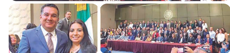
Participaron autoridades de la FGR y representantes de las 32 fiscalías del país.