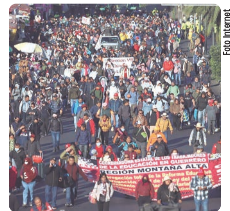
Al grito de "¡Si no hay solución, no habrá mundial!", los maestros intensificaron sus reclamos.

Tras intentar cercar Palacio Nacional y protestar frente a la Cámara de Dipu-