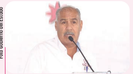
Adolfo Núñez, secretario de Educación y Cultura estatal.

da beneficiará a miles de estudiantes de educación básica, quienes podrán desarrollar sus actividades en un entorno más seguro y funcional. Además, subrayó que el programa contempla atención a escuelas rurales y con infraestructura limitada, para garantizar equidad y oportunidades en todos los municipios.