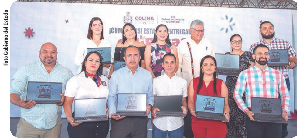
Aspecto de la entrega de laptops gratuitas a docentes de Villa de Álvarez.

la vocación, porque eligieron esto como aquello a lo que se querían dedicar toda su vida; porque todos los días, desde que estudiaron su carrera -hasta todos los cursos que van llevando a cabo-, la utilizan preparándose, mejorando, actualizándose para servir a las niñas y a los niños que reciben en el aula, a las niñas y niños que están en los planteles educativos", señaló.