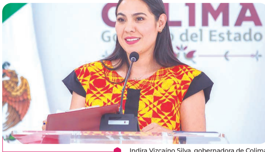
Indira Vizcaíno Silva, gobernadora de Colima.