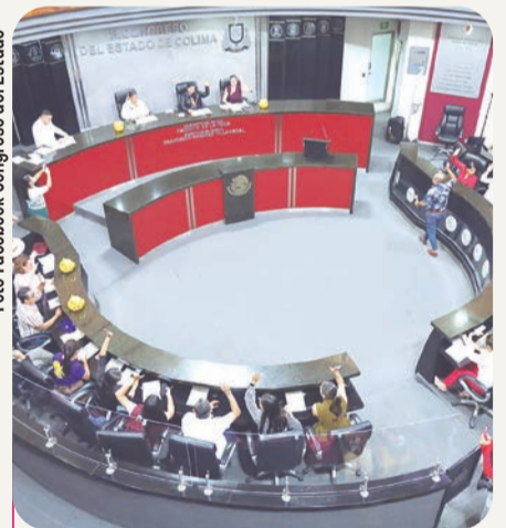
El premio reconoce a personas y agrupaciones que promueven la inclusión y la igualdad de oportunidades.

tulación y descripción de las acciones o méritos que fundamenten su candidatura.