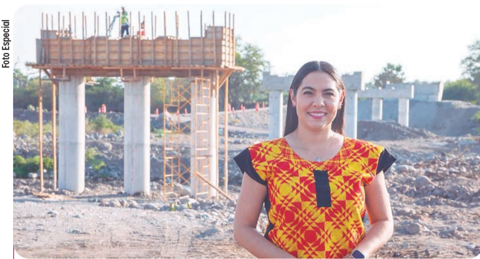
En este puente se invertirán 105.4 millones de pesos.

Acompañaron a la gobernadora la titular de la Secretaría de Infraestructura, De-