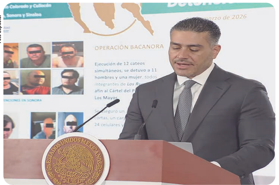
Foto Especial Los cateos se ejecutaron en Culiacán, Mexicali y San Luis Río Colorado.

La Operación Bacanora busca debilitar estructuras delictivas vinculadas al Cártel de Sinaloa mediante operativos coordinados en varias entidades del país.