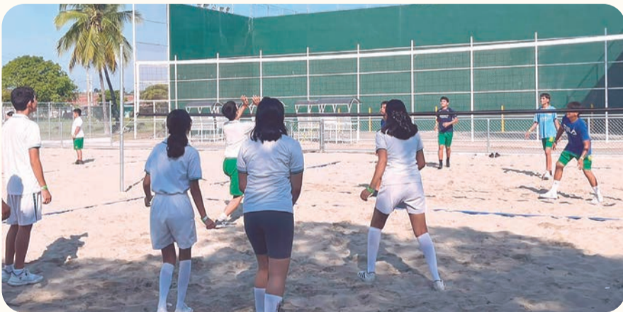
La competencia se realizará del 2 al 4 de abril en Cofradía de Hidalgo.