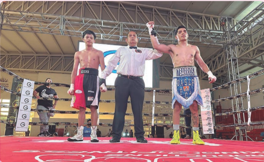
La función se realizó en el Auditorio Multifuncional de la Unidad Deportiva Morelos.