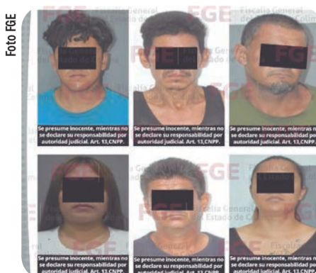
Uno de los detenidos fue entregado a las autoridades de Jalisco.

Cabe señalar que una de las personas fue localizada y detenida en el municipio de Colima; posteriormente fue entregada a autoridades de la Fiscalía del Estado de Jalisco, al contar con un requerimiento judicial vigente en dicha entidad.