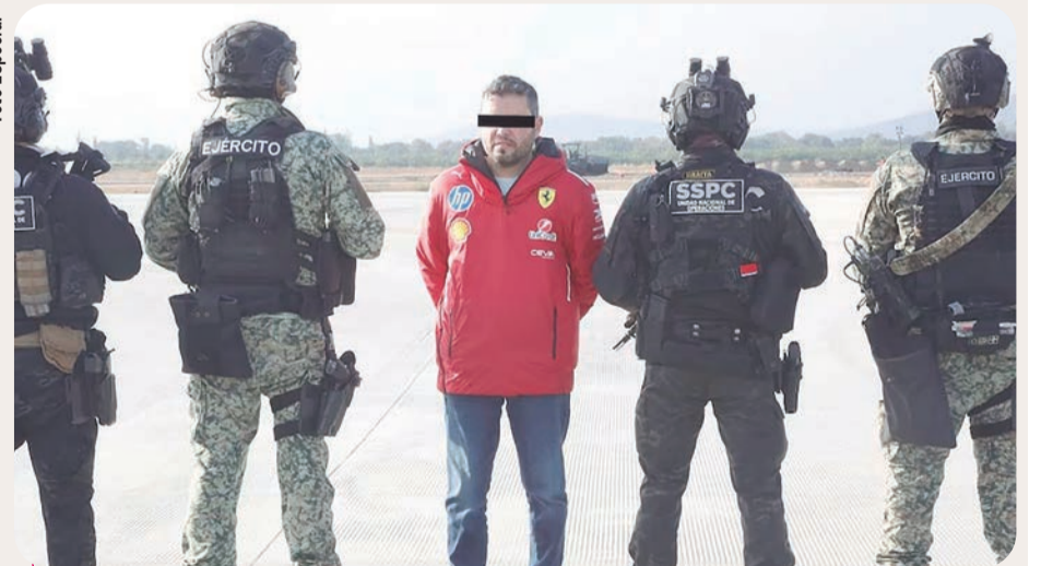
Diego "N" fue detenido por presuntos nexos con el Cártel Jalisco Nueva Generación.

Ayer se informó que esta decisión del juez no implica que el exfuncionario quede en libertad y abandone el penal de máxima seguridad del Altiplano, sino que la determinación judicial tiene el objetivo de que sea detenida la apertura del jui-