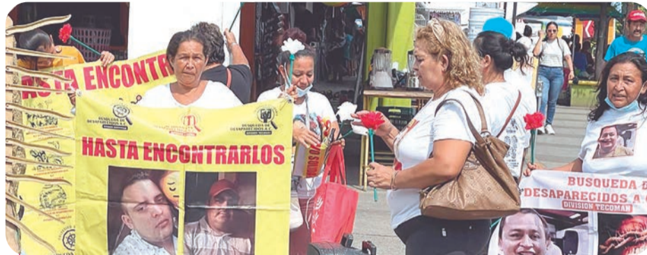
Los colectivos piden que continúen las investigaciones y trabajos periciales en el Rancho Izaguirre.

zano, integrante del Colectivo Solidario de Búsqueda de Personas, quien explicó que, aunque varias mujeres identificaron camisas, pantalones o zapatos, no existen restos que permitan realizar pruebas científicas para confirmar la identidad.