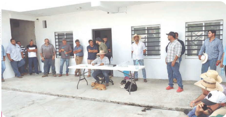
Los manifestantes advirtieron que permanecerán en las instalaciones hasta garantizar la renovación formal de la dirigencia.