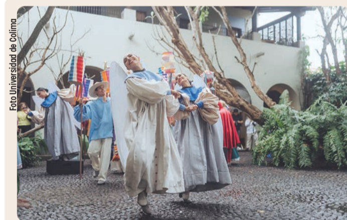
El Ballet Folklórico de la Universidad de Colima interpretó Nacimiento Colimote .

Guillermo del Toro recibió cuatro nominaciones a los Globos de Oro 2026.