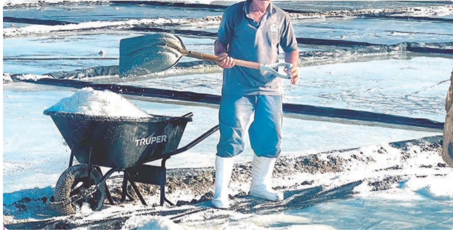
Las Salinas de Cuyutlán son un símbolo de identidad cultural que ha resistido el paso del tiempo.