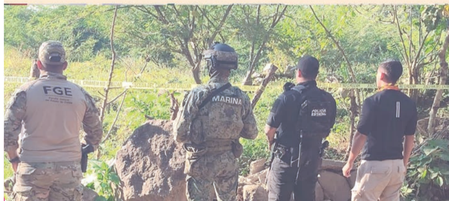
Los restos fueron trasladados a los laboratorios de la Dirección General de Servicios Periciales y Ciencias Forenses.