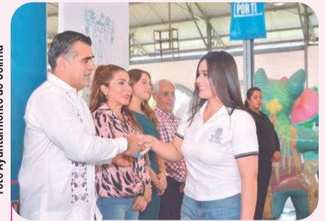
A través del programa "Movilidad Juvenil Por Ti" se entrega este apoyo a estudiantes.

El beneficio es para jóvenes universitarios de distintos centros educativos que diariamente se trasladan desde localidades de Colima, Jalisco y Michoacán hacia la capital del estado