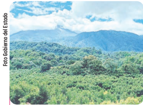
Esta zona está libre del barrenador grande y pequeño del hueso del aguacate, y de la palomilla barrenadora.

La Secretaría de Desarrollo Rural (Subseder) estatal dio a conocer que hace unos días se publicó en el Diario Oficial de la Federación (DOF) el acuerdo por el que se declara como zonas libres del barrenador grande y pequeño del hueso del aguacate, y de la palomilla barrenadora del hueso, a la zona agroecológica conocida como El Guardián del Volcán, en Comala.