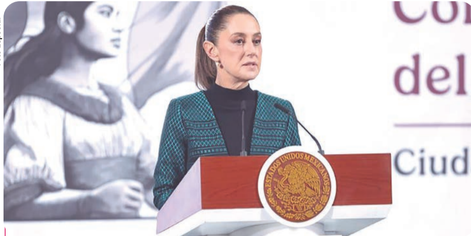
Entre las acciones del plan está crear una Fiscalía Especializada en Delitos de Alto Impacto.