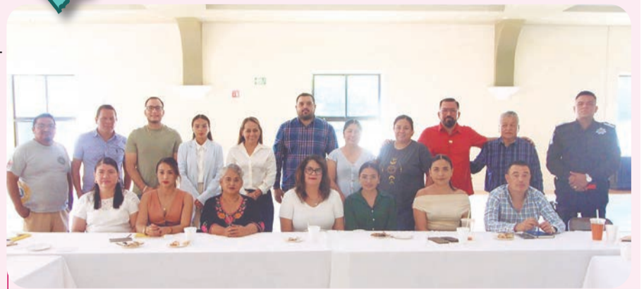
Autoridades municipales y educativas validaron el plan de acción para fortalecer la educación en el municipio.