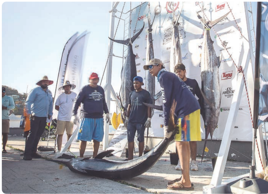
Aspecto del Torneo Internacional de Pesca.

“Lo que buscamos es que este tipo de eventos no solo sean para los amantes de la pesca deportiva, sino recuperar la esencia de este deporte, que es la sana convivencia, el fortalecimiento