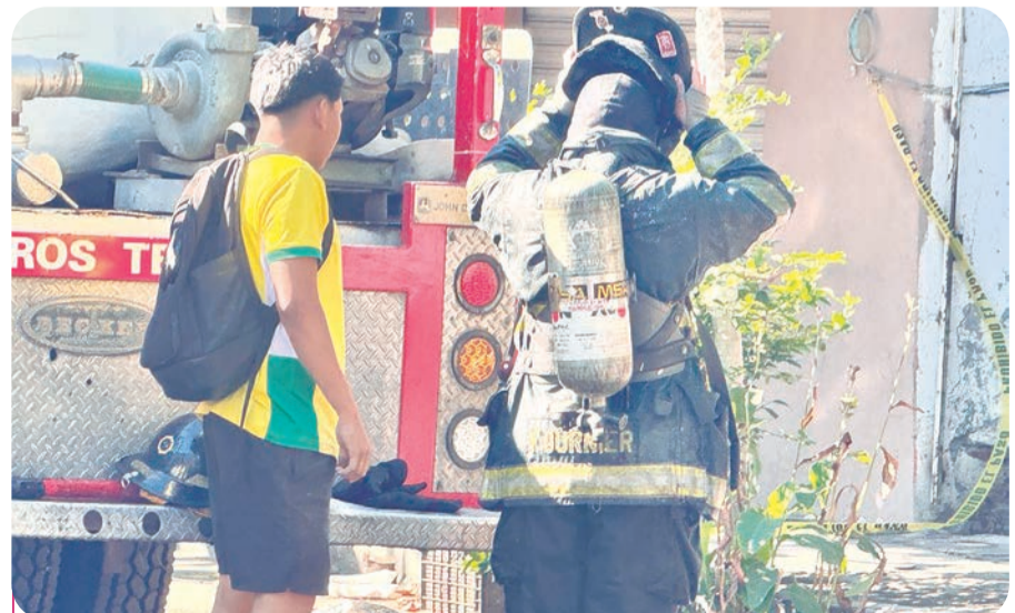
Los elementos abordarán nuevos retos como autos eléctricos y energía solar.