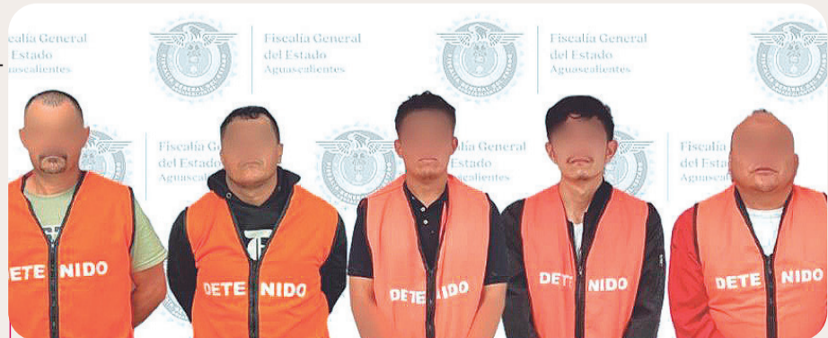
El Canelo fue capturado junto a cuatro sujetos más, presuntos integrantes del Cártel de Sinaloa.

A los detenidos se les relaciona con actividades de delitos contra la salud, privación ilegal de la libertad, vínculos con