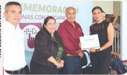
Reconocen al personal de Educación Especial y el compromiso de directivos, docentes y estudiantes de CAM.