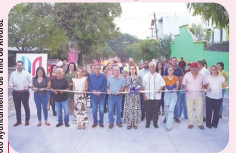
A algunas vialidades se les cambió la carpeta asfáltica y a otras se les colocó concreto asfáltico.

Se rehabilitó la carpeta asfáltica de la calle Josefa Ortiz de Domínguez, en la zona Centro de la ciudad, en el tramo que va de la Avenida Benito Juárez hasta la calle Cristóbal Colón, una obra que fue solicitada por vecinos del lugar