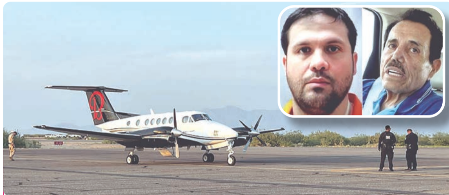
El Güero afirmó que Estados Unidos no intervino ni aprobó el secuestro de El Mayo Zambada.

Durante la audiencia, El Güero aseguró que antes del 25 de julio del año pasado se comunicó con El Mayo para convocarlo a una reunión en Sinaloa, bajo el argumento de resolver un desacuerdo.